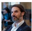
Mauro Lunghi – Architetto - Wip Architetti