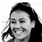
Giusy Versace* , campionessa paraolimpica di atletica

Sciatore nautico e dirigente sportivo italiano, cieco dalla nascita. Ha conquistato 25 titoli mondiali, 27 titoli europei e 41 titoli italiani. In virtù dei risultati ottenuti a livello internazionale, è considerato il più grande sciatore nautico paralimpico di tutti i tempi.