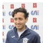
Francesco Messori* , capitano nazionale calcio amputati

Prima donna nella storia italiana a correre con doppie protesi in fibra di carbonio, atleta paralimpica nella categoria atletica leggera, campionessa di corsa sui 100, sui 200 e sui 400 m, dove ha vinto 11 titoli italiani. Nel 2011 ha fondato Disabili No Limits Onlus , oggi è Membro della Camera dei deputati della Repubblica Italiana.